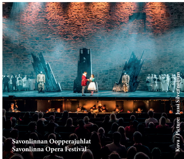
Savonlinnan Oopperajuhlat Savonlinna Opera Festival